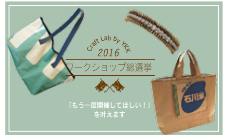
参加したいワークショップに投票したら、実現するかも?!