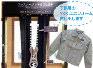
ジャンボファスナーと写真を撮ろう!