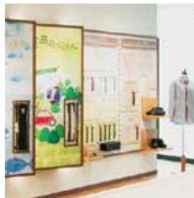
展示コーナーもあります