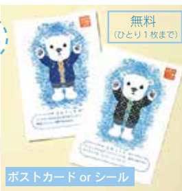
ポストカード or シール きせかえくまちゃんて遊ぼう