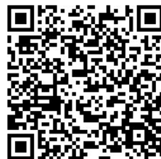
クリエイターズ マーケット情報